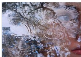
Dominika Kędzierska, Reflection XIII, 120x80cm, olej na płótnie, 2022, kedzierska.art