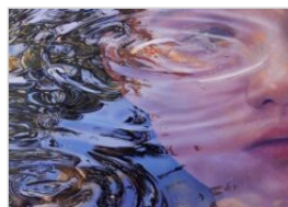
Dominika Kędzierska, Reflection XIII, 120x120cm, olej na płótnie, 2022, kedzierska.art